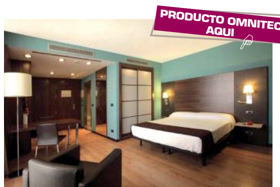
HOTEL PH Rey Fernando II de Aragón Pla-za (Zaragoza) Cajas Magnum