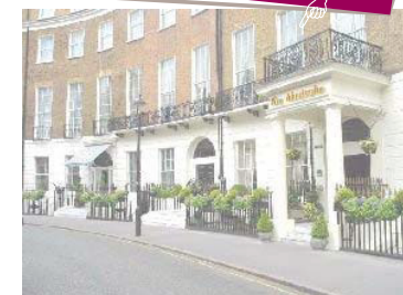
MONTCALM HOTEL London (UK) Cerraduras Gaudí RF