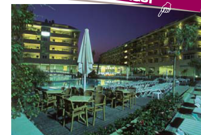
HOTEL AQUAHOTEL Onabrava Santa Susanna, Barcelona Minibares A-40